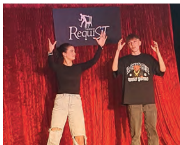
Fortsetzung von Seite 11

Das Konzept der Präventionsveranstaltung basiert auf einer Show zu beliebigen Themen, die aus dem Publikum zugerufen und dann spontan auf der Bühne inszeniert werden. Mögliche Gesprächsrunden zum